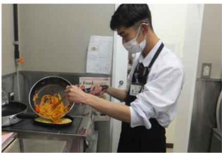
ナポリタン&サンドウィッチ作り