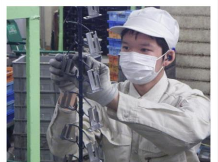
めっきの製造、加工