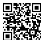
名古屋聾ホームページ